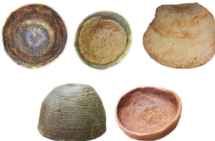
Фрагмент иллюстрации к статье Ю. Б. Цетлина «Происхождение лоскутного налёпа»

Древнейший технологический прием изготовления глиняных сосудов – лоскутный налёп – был широко распространен в неолите у разных народов Евразии. Однако до сих пор вопрос о его происхождении не обсуждался в археологической литературе. Как полагает автор, технология лоскутного налёпа происходит из традиций обмазывания плетеных сосудов небольшими порциями глиняной массы. В основу гипотезы легли многочисленные археологические и этнографические свидетельства, а также результаты экспериментов.