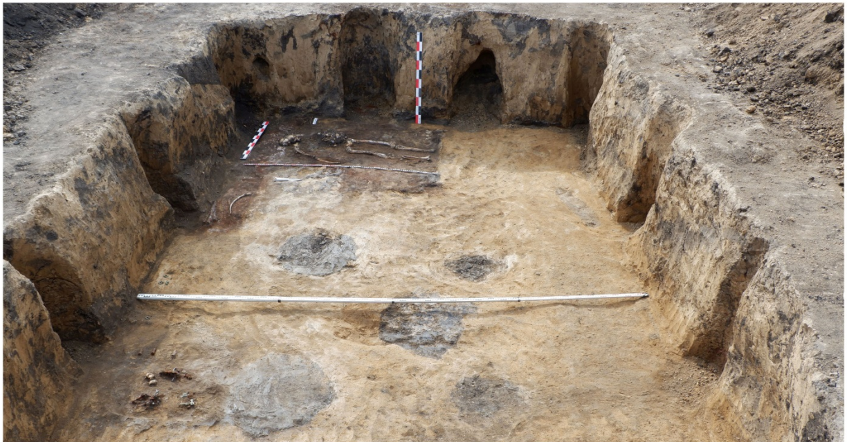
Общий вид погребения кургана 7 могильника Девица V

В 2021 году экспедиция ИА РАН исследовала курган 7 могильника Девица V (Воронежская область) – самую крупную насыпь некрополя, которая располагалась в центре курганной группы. В центральном погребении были найдены останки мужчины в возрасте старше 45 лет, со следами давних множественных переломов и свидетельствами избыточного веса, заболеваниями суставов и нарушения обмена веществ. Исследование останков позволила диагностировать диффузный идиопатический скелетный гиперостоз (болезнь Форестье): это хроническое невоспалительное заболевание, при котором происходит избыточный рост костной массы и окостенение связок, чаще всего возникающее после 40-50 лет, в основном у мужчин. Изотопные исследования позволили установить, что его диета была высокобелковой: на протяжении многих лет основу его питания составляла мясо-молочная пища.