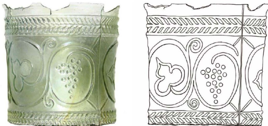
Иллюстрация к статье О. С. Румянцевой, И. В. Рукавишниковой, Д. В. Бейлина, В. С. Червяковского «Стекло́нный кубок с декором виноградной лозой из могильника Александровские скалы 1 (Восточный Крым)»

В I веке н. э. была изобретена техника изготовления стеклянных сосудов, при которой расплавленное стекло выдувалось в заранее подготовленную резную форму. Изготовленные в этой технике сосуды создают устойчивые по морфологии и характеру изображений серии, но каждая новая находка всегда привлекает особое внимание исследователей. Именно такой кубок был обнаружен в 2017 году при раскопках могильника Александровские скалы 1 в окрестностях Керчи. Погребение с кубком датируется серединой I – началом II века н. э. Оно принадлежало мужчине, который был похоронен в деревянном саркофаге с гипсовым декором, что, наряду с находкой кубка, говорит о не рядовом характере захоронения.