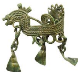
Фрагмент иллюстрации к статье Н. А. Макарова, А. М. Красниковой, В. А. Шевченко « Могильник Сельцо: потерянный некрополь X–XI вв. под Суздалем ».

Статья: Происхождение лоскутного налёпа . Автор: Ю. Б. Цетлин (ИА РАН).